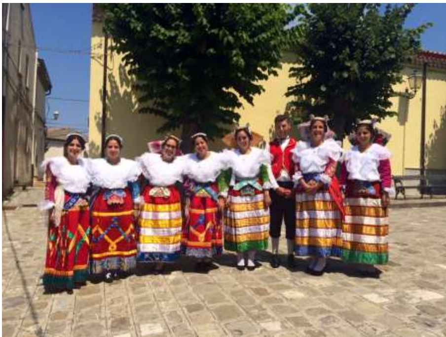
Costumi arbëreshë, San Paolo Albanese, 13 agosto 2015