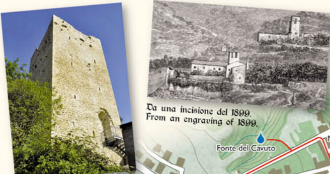
Da una incisione del 1899. From an engraving of 1899.