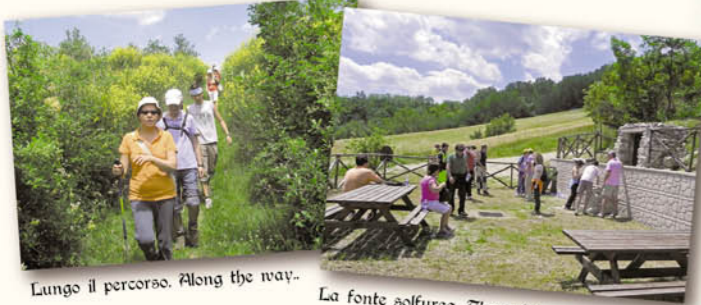
Lungo il percorso. Along the way. La fonte solfurea. The sulphur spring.

Nell'ambito delle proprie finalità statutarie l'Associazione Civita dell'Abbadia si propone la tutela e valorizzazione del territorio pedemontano vestino, luoghi ricchi di storia, cultura e paesaggi suggestivi. Territori che nel medioevo sono stati protagonisti della vita religiosa e socioeconomica del centro-sud Italia grazie alla presenza di importanti abbazie quali il monastero Benedettino di San Bartolomeo di Carpineto della Nora fondato nel 962 e l'Abbadia di S. Maria di Casanova edificata nei pressi di Villa Celiera, allora compresa nel territorio di Civitella, intorno al 1197. Attraverso il progetto "Tra le due Abbazie: frammenti di vita, storia e vicissitudini all'ombra delle abbazie di San Bartolomeo e Santa Maria di Casanova" vogliamo aprire uno scorcio sul passato e farlo conoscere all'escursionista e al visitatore, attraverso visite organizzate per attivare il circuito del turismo religioso e gastronomico, veri punti di forza dell'area. Con questo auspicio, Vi invitiamo a partecipare.