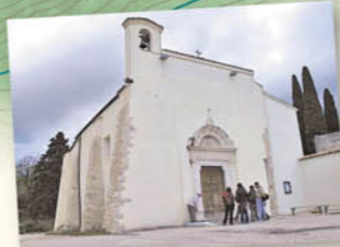
S. Maria della Cona.