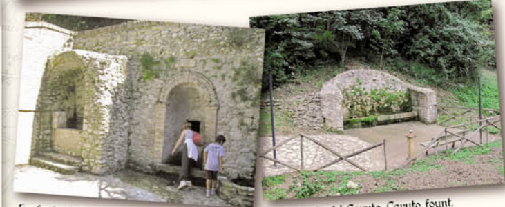
La fonte di S. Michele. San Michele fount. La fonte del Cavuto. Cavuto fount.