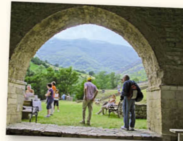
L'ingresso della Badia. The entrance of the Abbey.

The Benedictine Abbey of San Bartolomeo di Carpineto, on the eastern slopes of the Gran Sasso, in the diocese of Penne, was built by Bernardo son of Liuduno, Earl of Pens in 962, who soon became famous and powerful. The foundation took place in the immediate vicinity of a watercourse. The years up to the first half of the eleventh century are of continuous growth because the monastery was endowed with many territories such as the Castle of Carpineto, Fara and some lands of the Tritana Valley, considerably expanding its borders. In 1258 it adopted the Cistercian rule because Alexander IV decided, in a period of decline, to entrust the monastic society with all its possessions to the Cistercian monks of Santa Maria Casanova.