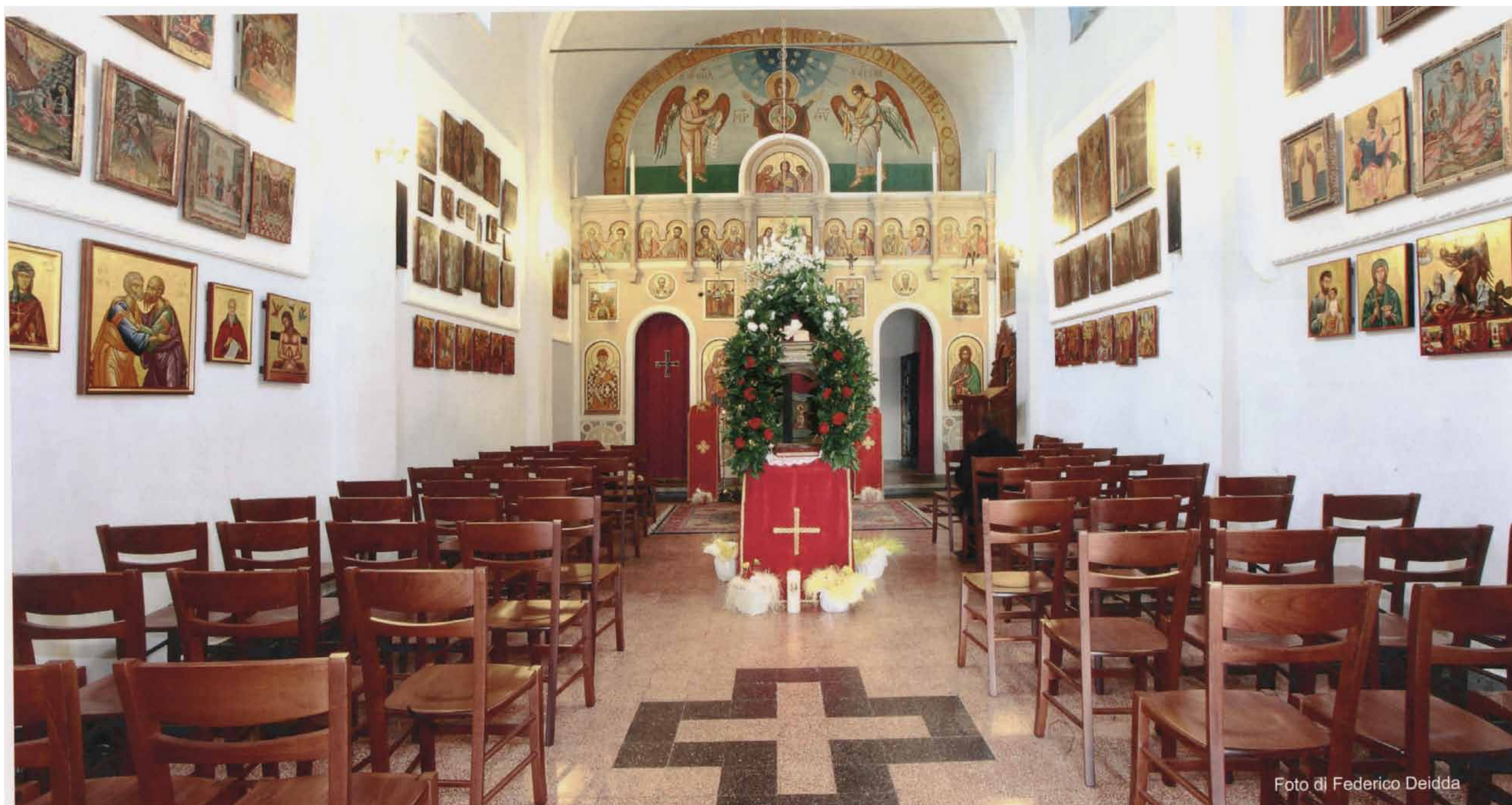
Interno della chiesa Santa Maria Assunta, Villa Badessa.