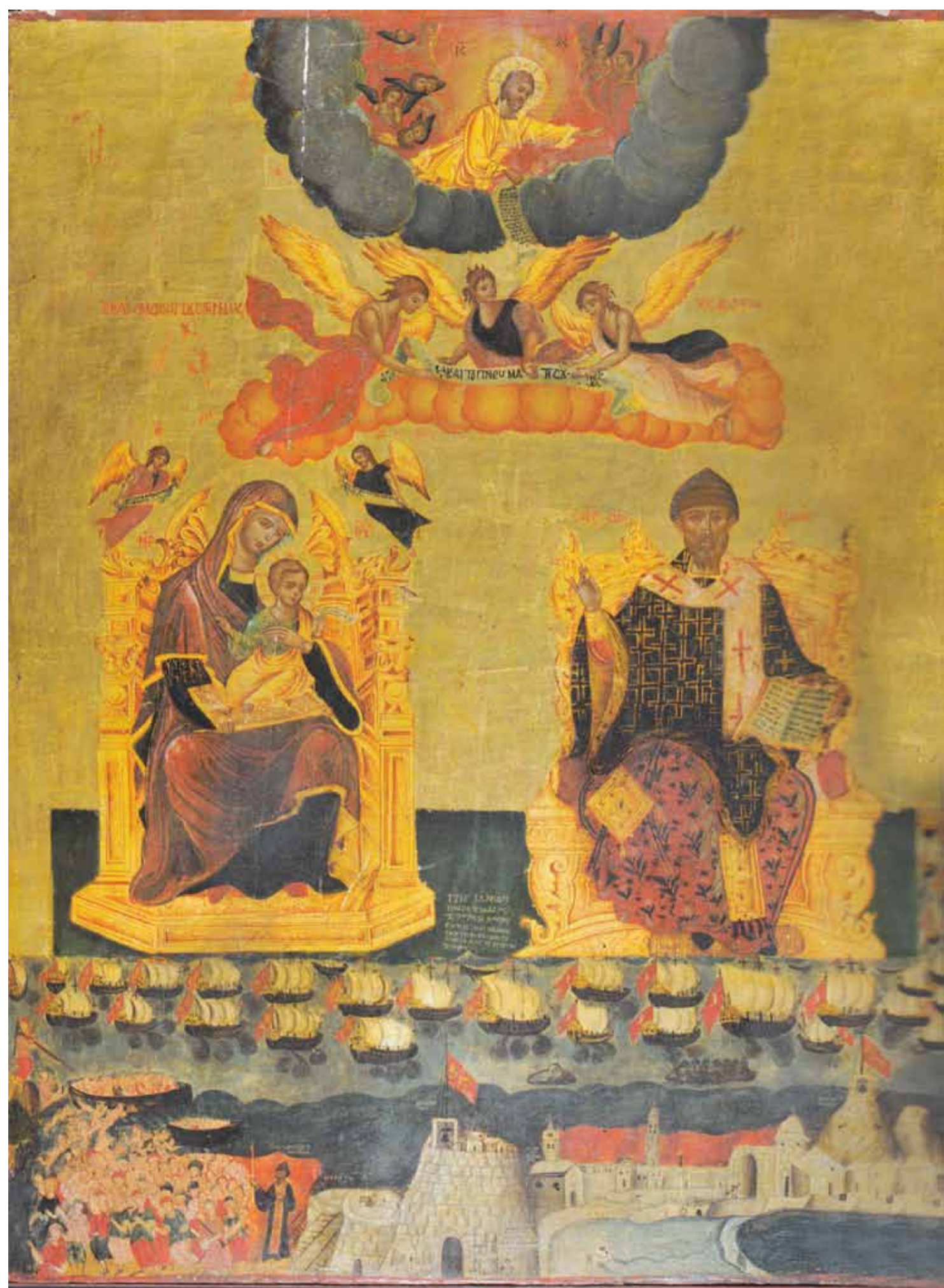
Il Miracolo di Corfù. Chiesa Santa Maria Assunta, Villa Badessa. (Autore ignoto, seconda metà-fine XVIII secolo)..