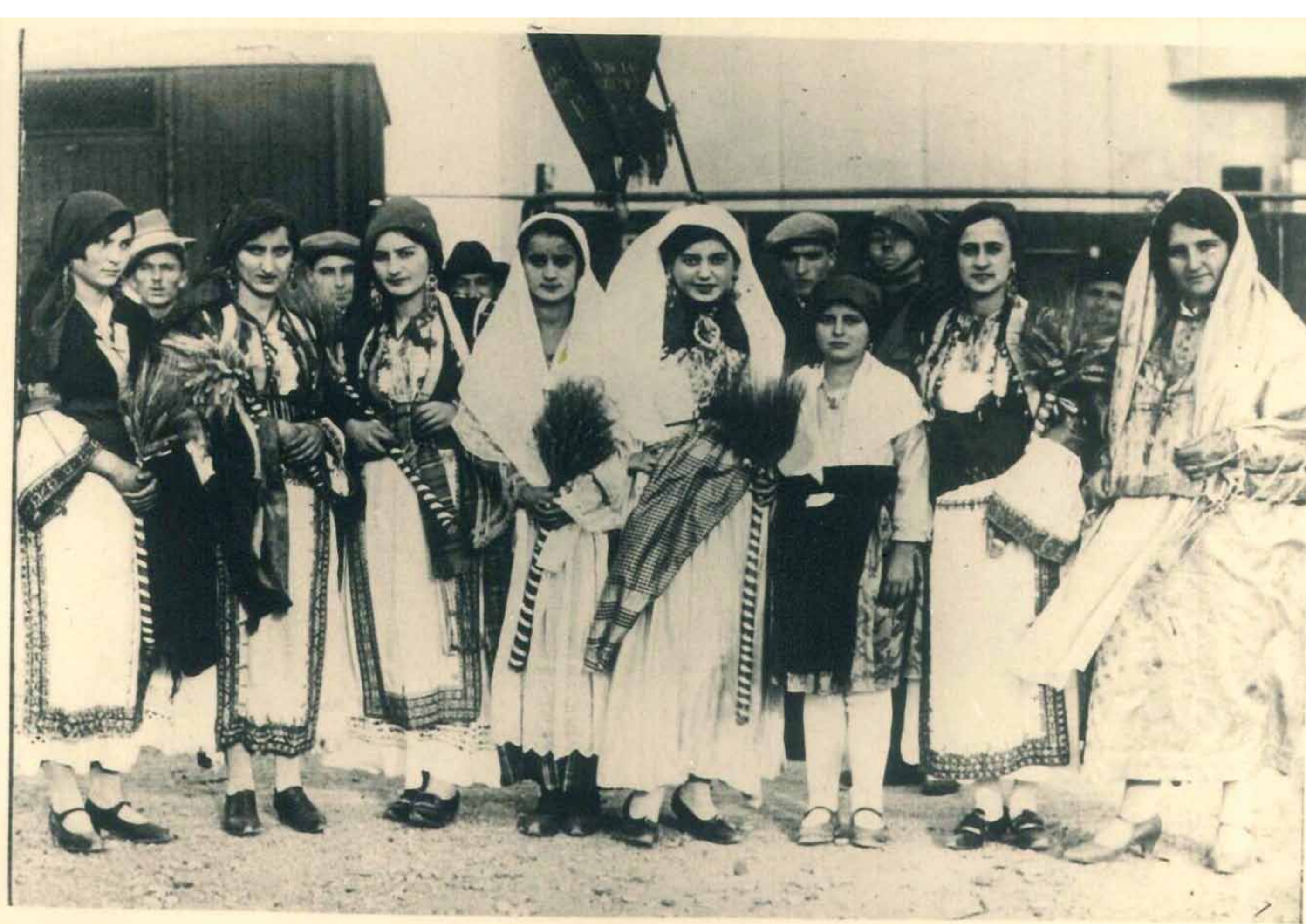
Donne in abito tradizionale "arbëresh". Villa Badessa, 1944.