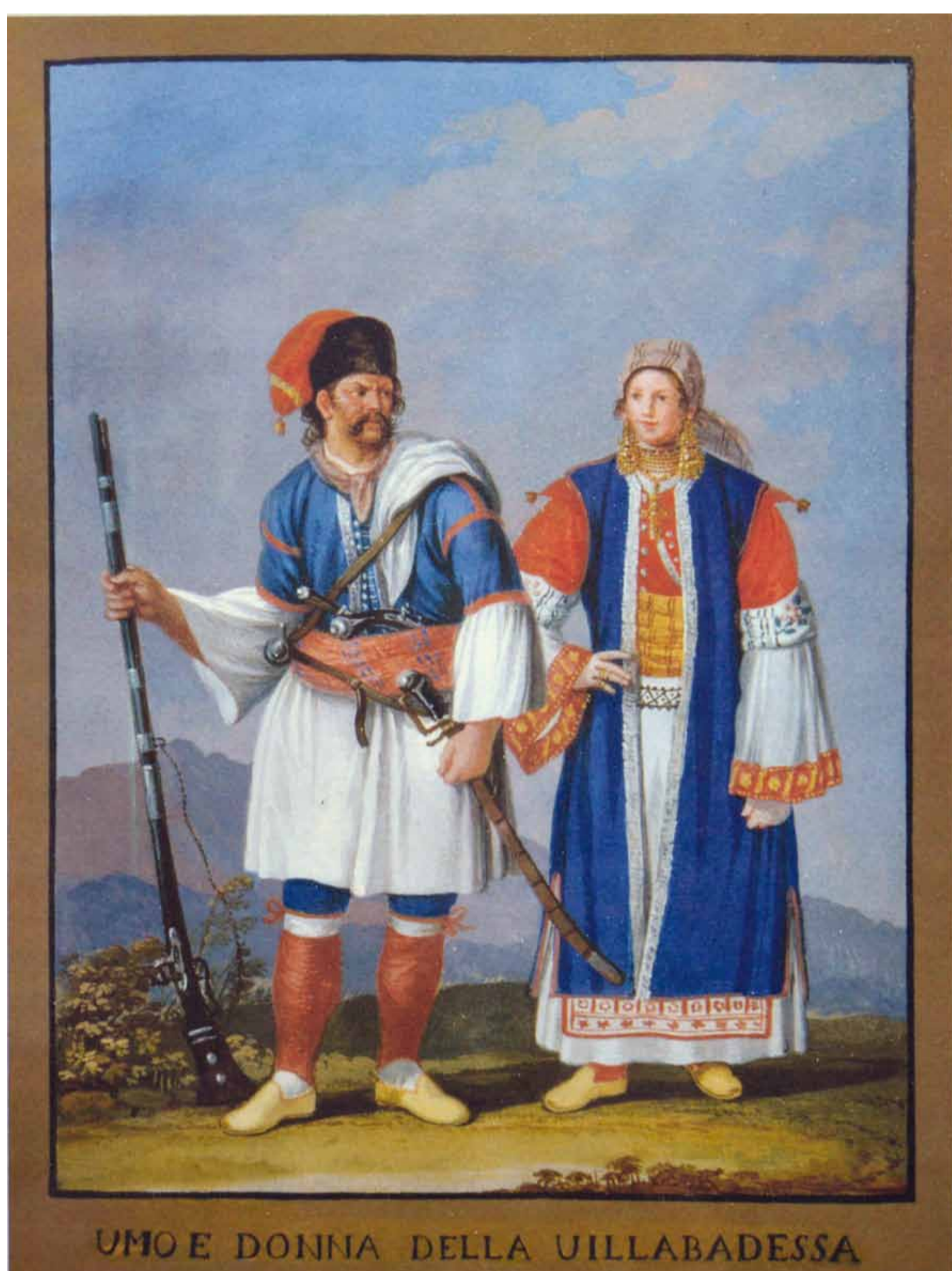
Uomo e donna della Villa Badessa, n. 208 del Corpus fiorentino delle Vestiture del Regno di Napoli. Attr. a Giacomo Milani. Gouache, Depositi di Palazzo Pitti, Firenze. (Fonte: M.C. SEMPRONI, Dalla tempera alle incisioni La fortuna iconografica, in Percorsi di uomini percorsi di fede Dall'est a Villa Badessa Immagini Icone Costumi, a cura di L. ARBACE-M.C. NICOLAI-M. RUGGIERI, 2012, p. 153).