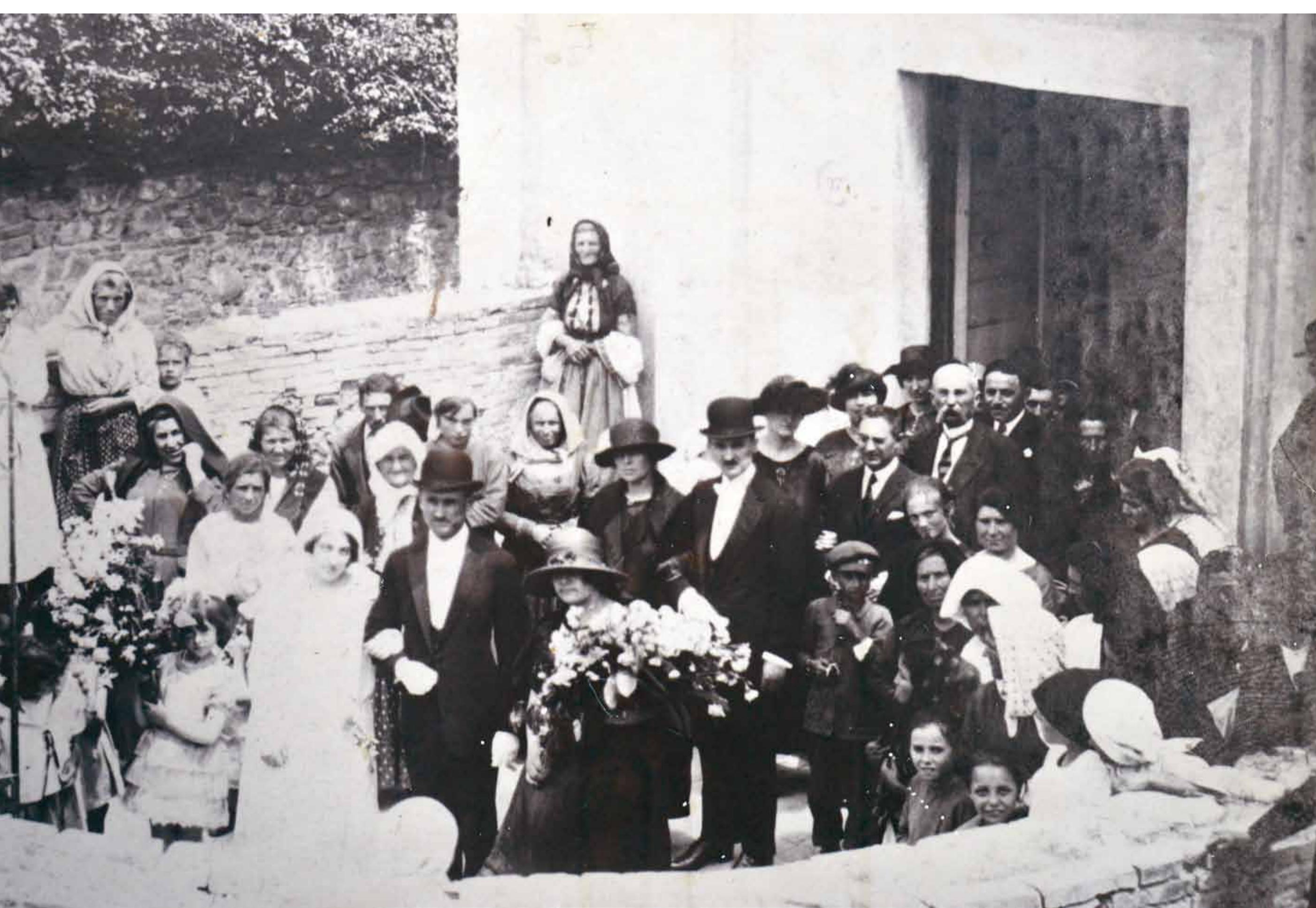
Foto ricordo di matrimonio, Villa Badessa, 1923.