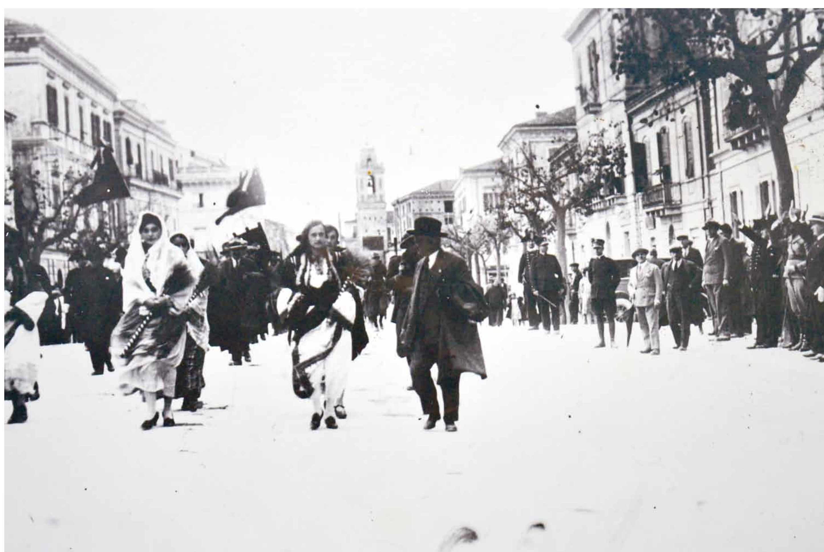
Donne in abito tradizionale "arbëresh" di Villa Badessa sfilano a Pescara, 1933. (Associazione culturale Villa Badessa, Archivio fotografico).