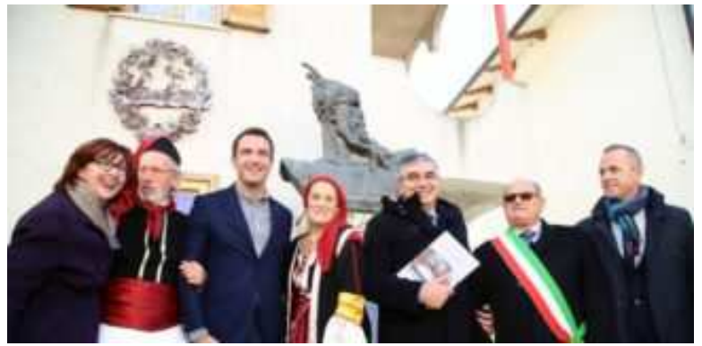
La visita del Sindaco di Tirana, Erion Veliaj in Abruzzo.