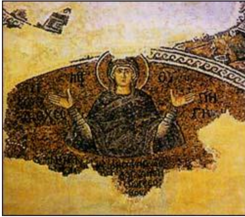
Madonna " Sorgente di Vita " nei mosaici della Chiesa "San Salvatore in Coro", presso il Santuario.