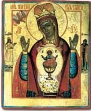
Icona della "Madre di Dio, il tuo grembo è divenuto sacra mensa", fonte di Vita Mosca, Ufficio Archeologico dell'Accademia Ecl. (sec. XIX).