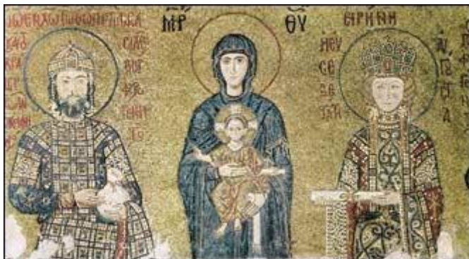
Mosaico della Madre di Dio con il Bambino Gesù, tra l'Imperatore Giovanni II Comeno e l'Imperatrice Irene [sec. XII] – Chiesa di Santa Sofia, Istanbul.

Un nuovo tipo di " Madonna Sorgente di Vita " sembra abbia fatto la sua comparsa nel secolo XVI. La più antica raffigurazione conosciuta risale al 1555: si riscontra in un affresco del pareclíision di San Giorgio nel Monastero athonita di San Paolo: Maria è seduta maestosa in una grande vasca di fontana simile alla fonte battesimale; è del tipo dell' Orante-Platytera [cioè: " più vasta dei cieli "] e tiene in grembo il Bambino. L'iscrizione è la stessa incontrata nelle raffigurazioni precedenti.