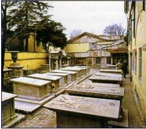
] Tombe dei Patriarchi di Costantinopoli nel Camposanto annesso al complesso del Santuario di Balıklı.

Il Kondakion e l' Ikos , a loro volta, prendendo in prestito il ritmo poetico dell' Acatisto , celebrano la Fonte identificata con Maria. L'Autore ricorre ed accumula molte immagini e figure tratte dalla Scrittura e dalla natura, il tutto espresso in poetiche salutazioni [ chairetismi o Ave ].