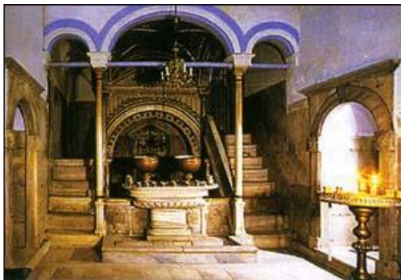
La Miracolosa fontana "Zoodochos Pege [Sorgente di Vita]" nella Cripta del Santuario di Balıklı, Istanbul.

Nel 1453 i Turchi musulmani, dopo un lungo assedio alla Capitale bizantina, conquistano Costantinopoli, che viene saccheggiata dalla soldatesca infuriata per la sua lunga resistenza. Saccheggiarono Chiese, Monasteri e Conventi; depredarono case e palazzi, portandone via non solo il contenuto, ma anche gli abitanti rimasti senza nessuna difesa.